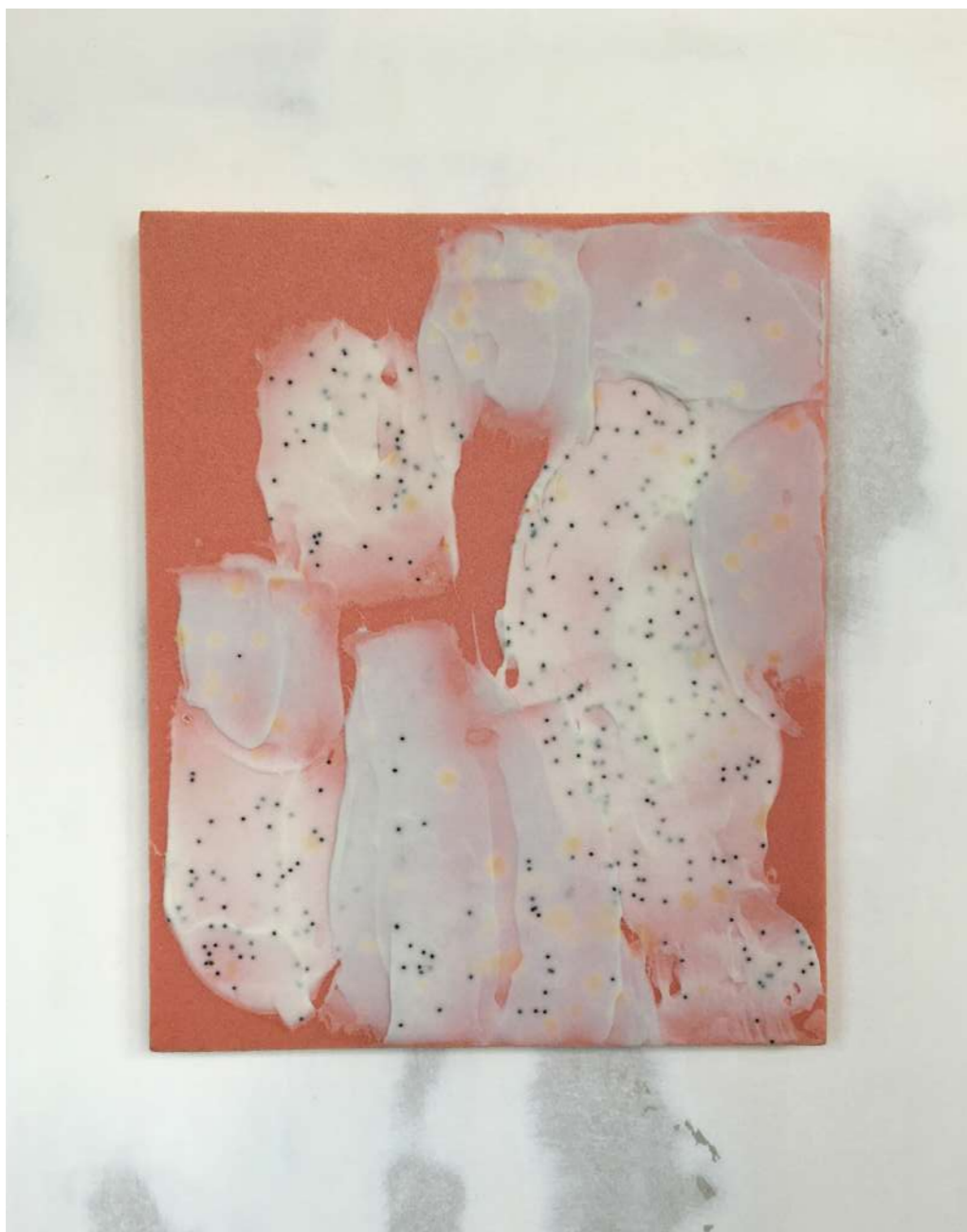
Peinture Savon, 2020 Styrodur, huile de coco, jus de grenade, pavot