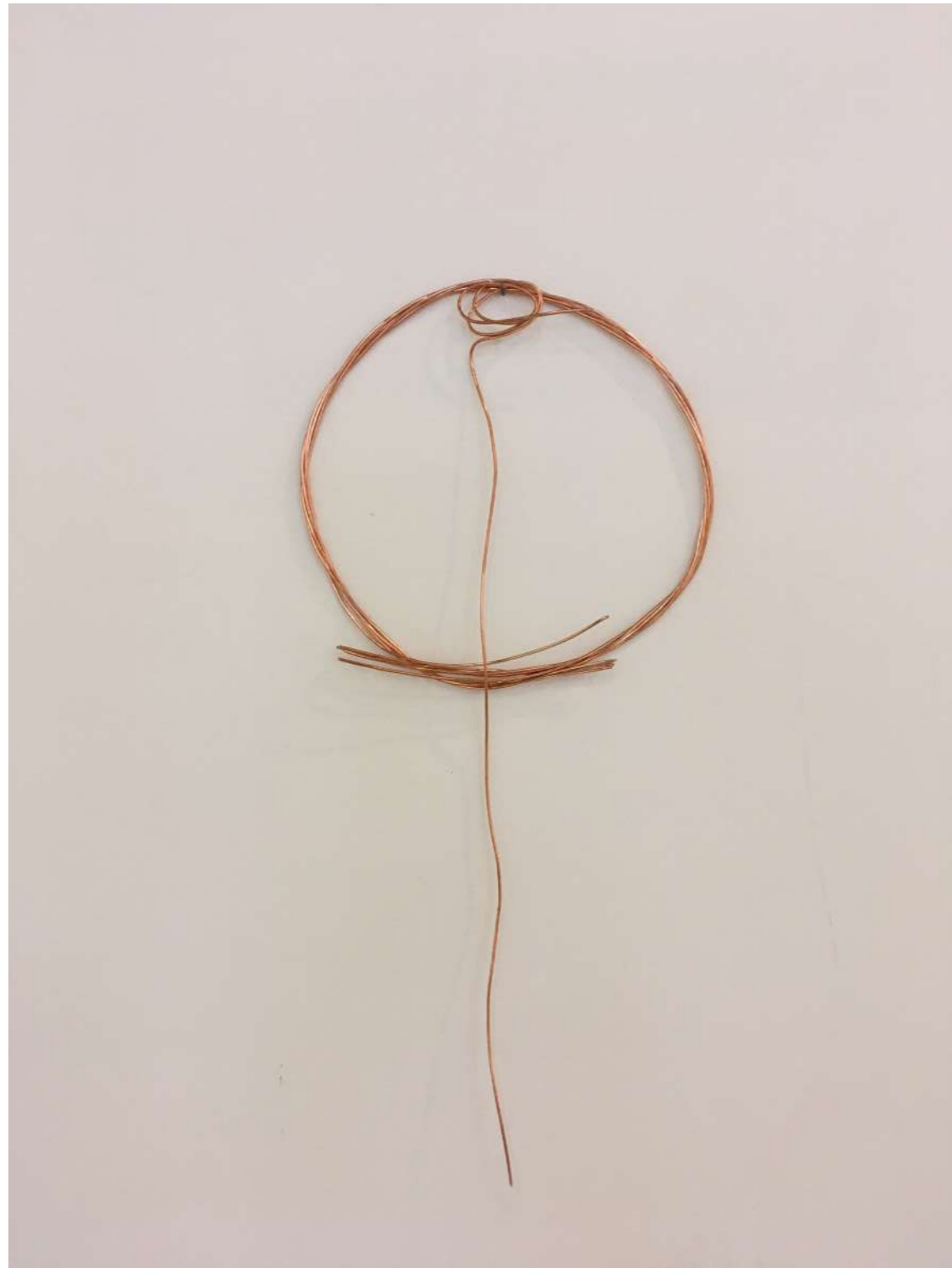
Fleur de cuivre, 2018 Cuivre