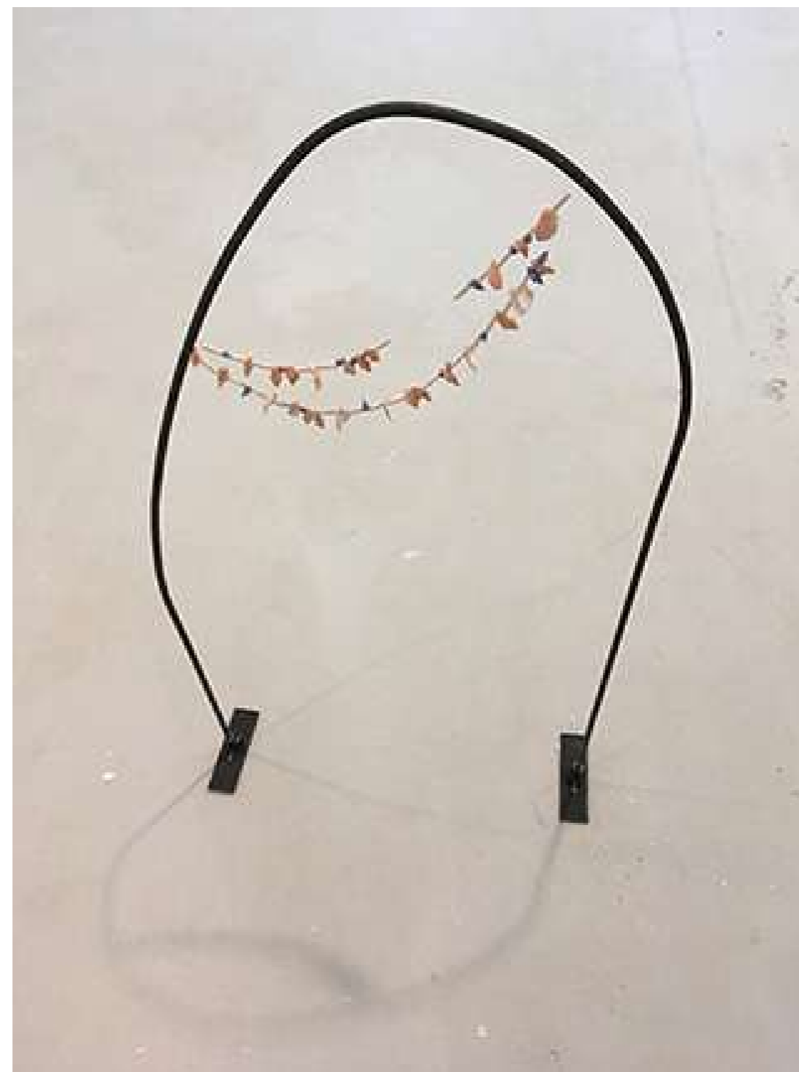
Arche, 2018 Métal, porcelaine