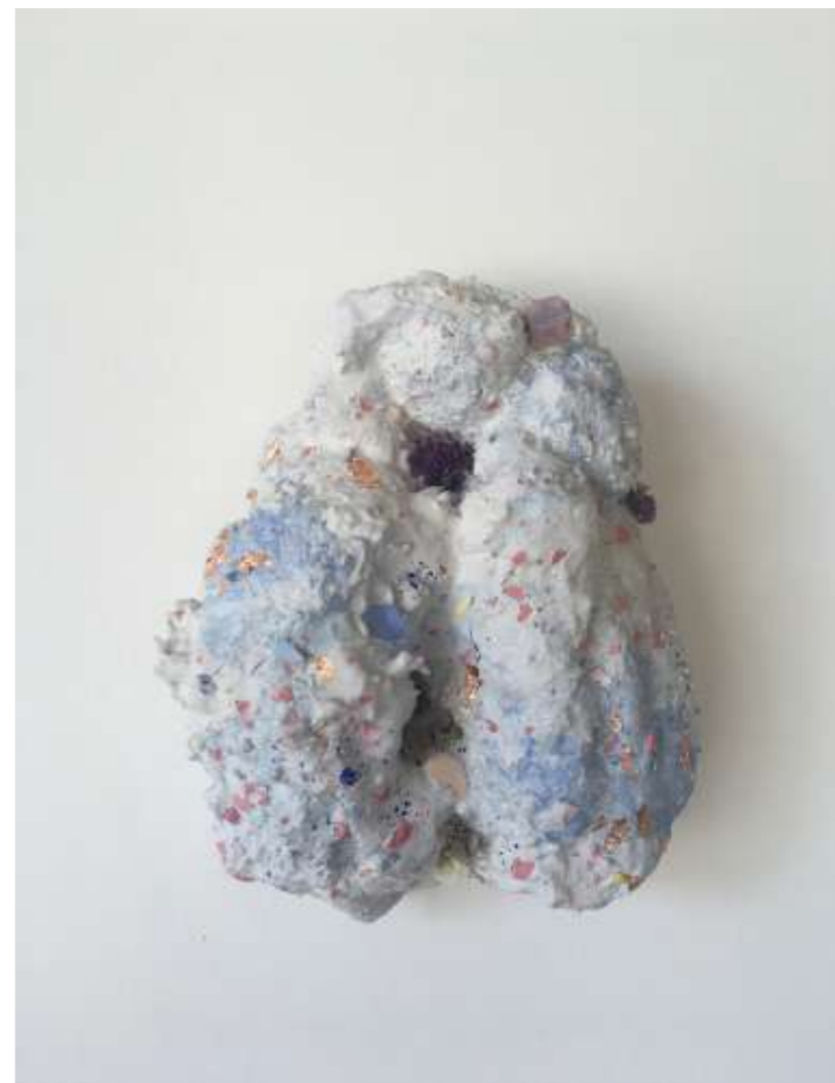
Sonio, 2018 Mousse expansive, fleurs, coquillages, résine acrylique