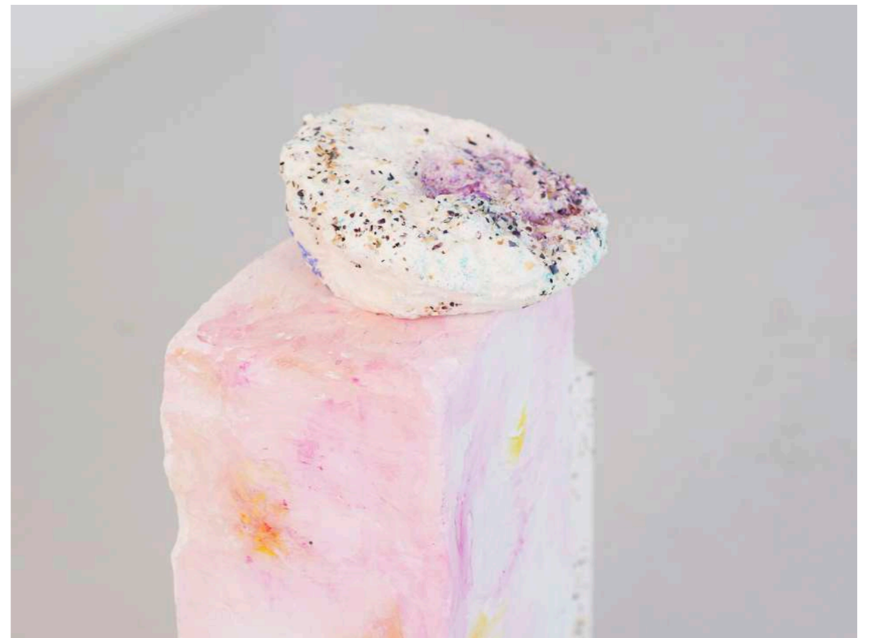
Sans titre, 2018 Mousse, pierre ponce, plâtre, béton, et matériaux divers Présenté à l'exposition Villà à la villa Rohannec'h en 2018