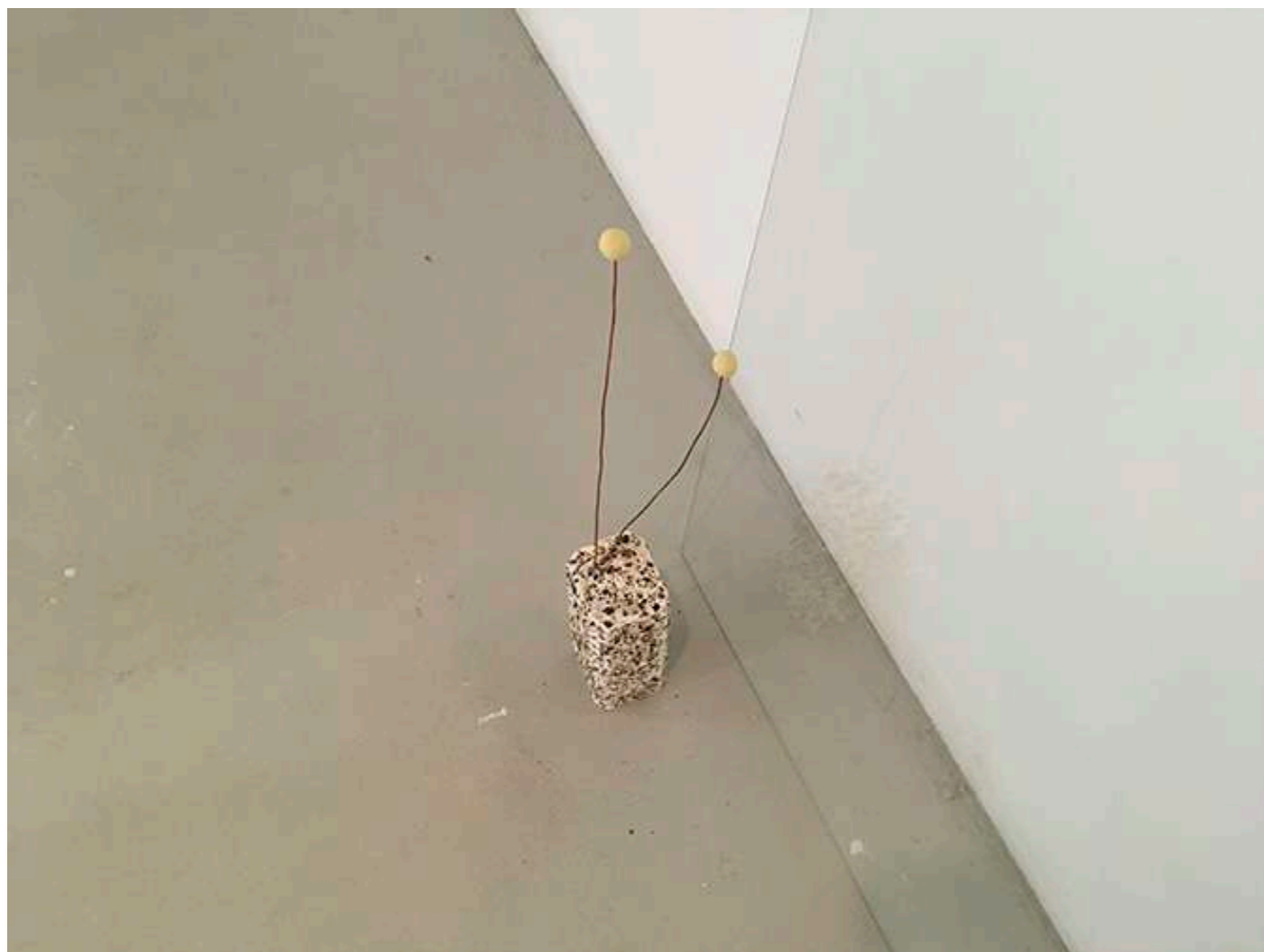
Sans titre, 2018 Styrodur, cuivre, coquillage, pigments, argile