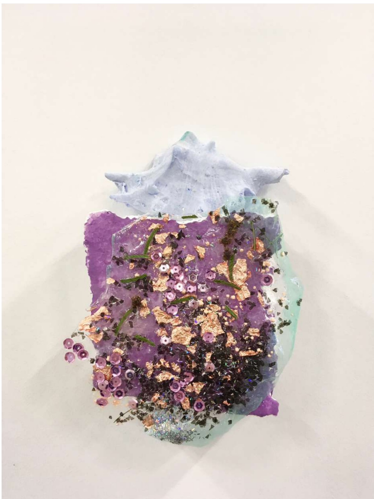
Flaque 1/2, 2018 Matériaux divers Production GENERATOR - 40mcube / Self signal / EESAB