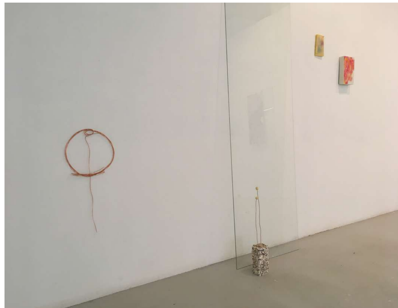
Venus as a boy, 2018 Détails de l'installation, DNSEP Lien de la musique dans l'espace: https://soundcloud.com/user-247197586