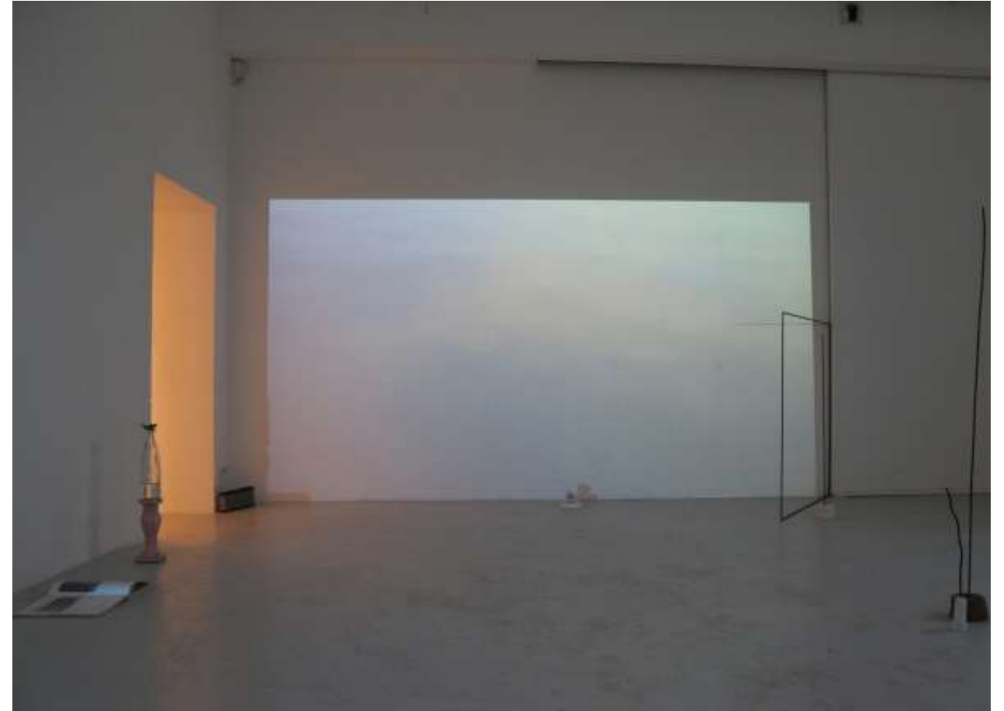
Μπλε συζήτηση, 2017

“Dans les fontaines, on aura déposé des oranges : elles flottent et se réunissent par agrégats rotonds, peau contre peau dans l'eau douce. (...) La tête hors de l'eau, on peut lever les yeux au ciel, encore une fois, pour y contempler des cumulo-nimbus très déliés, roses, jaunes ou légèrement bleutés, aux pigments encore imbibés.”