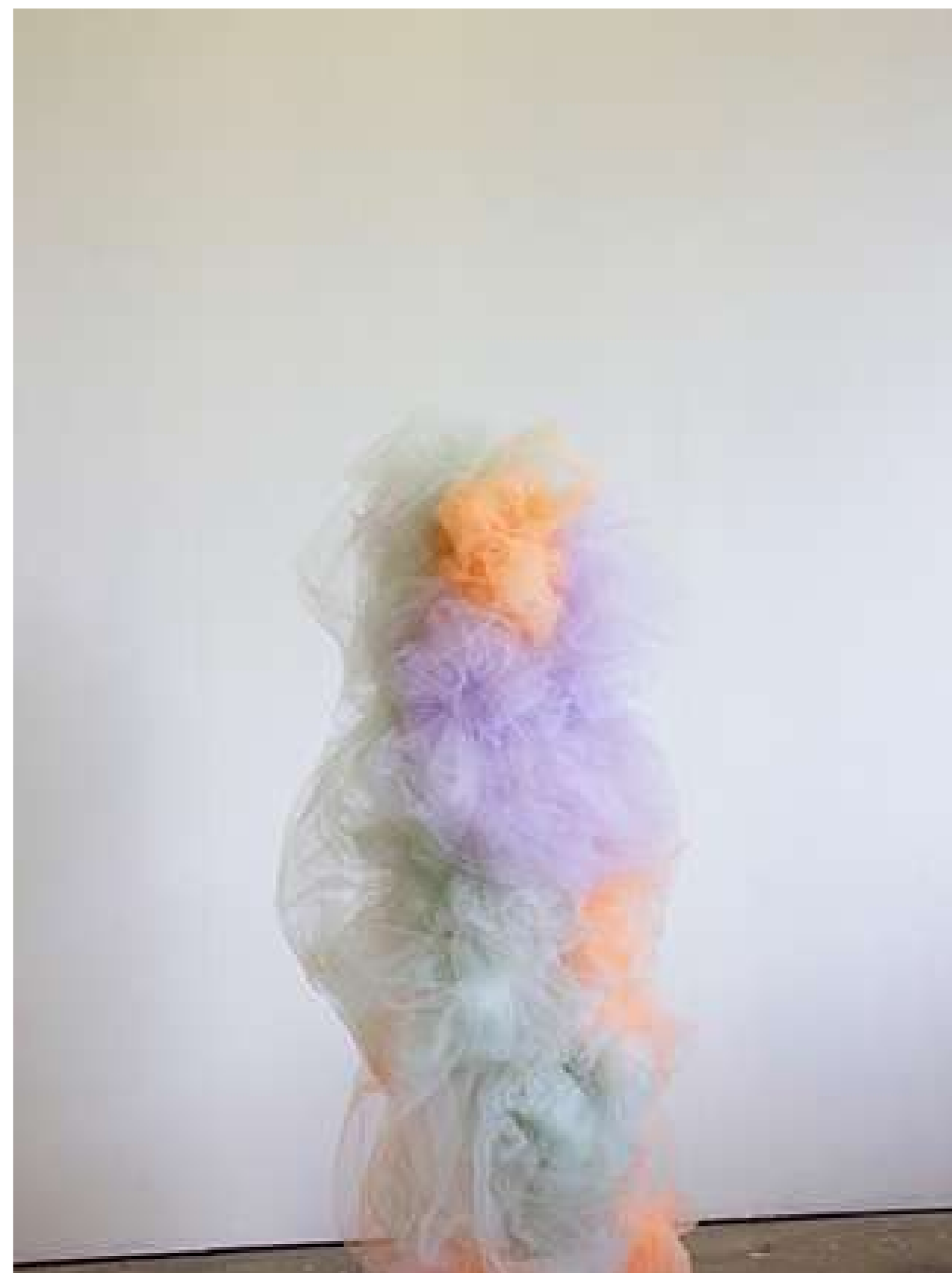
Barbu, 2019 Styrodur, tulles Production GENERATOR- 40mcube / Self signal / EESAB