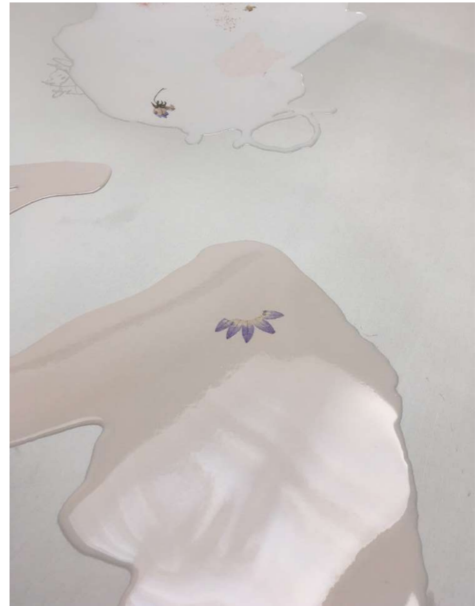
Maladie d'amour, 2020 Silicone, fleurs, bâche doré Atelier W, Pantin