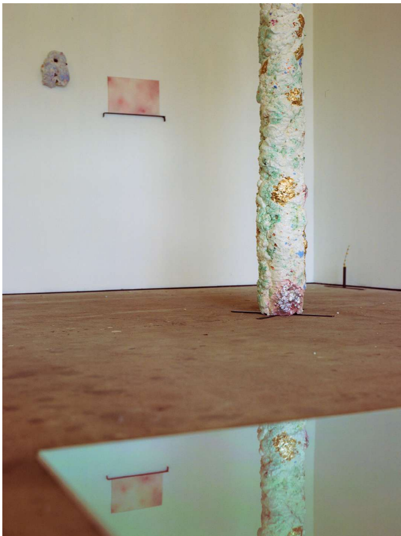
Le phénomène de l'éponge, 2019 Installation, colonne en mousse expansive et matériaux divers Production GENERATOR - 40mcube / Self signal / EESAB