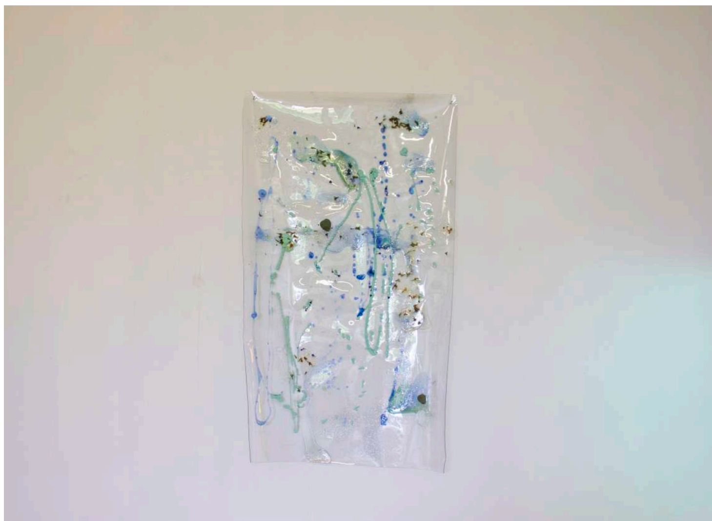
Sans titre, 2019 Peinture sur toile sîrré, matériaux divers