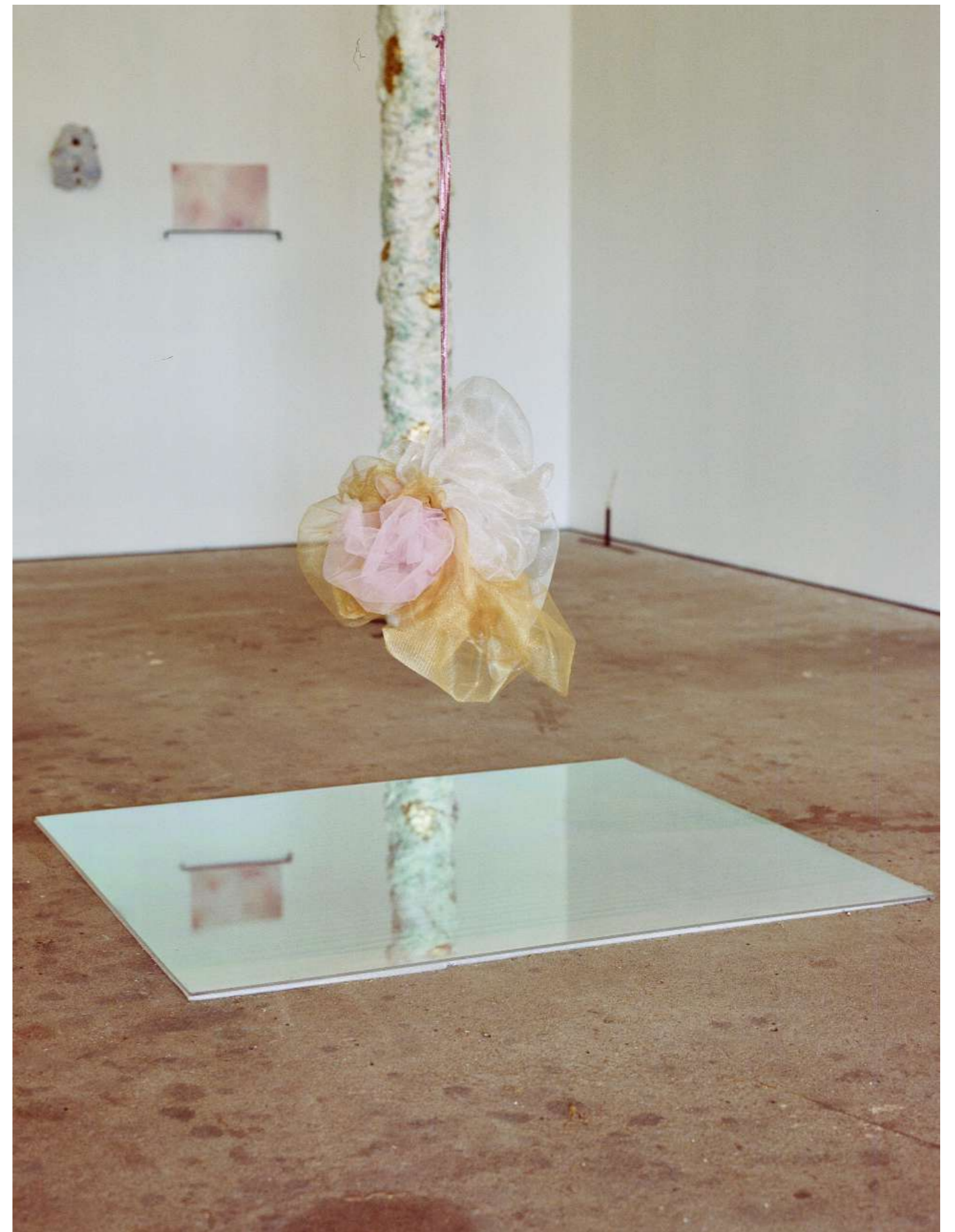
Le phénomène de l'éponge, 2019 Installation et reflets de lumière, plexiglass, film vinyl, tulle à paillettes Production GENERATOR - 40mcube / Self signal / EESAB

Extrait du texte critique par Sonia D'Alto , 2019, écrit dans le cadre de GENERATOR #5.