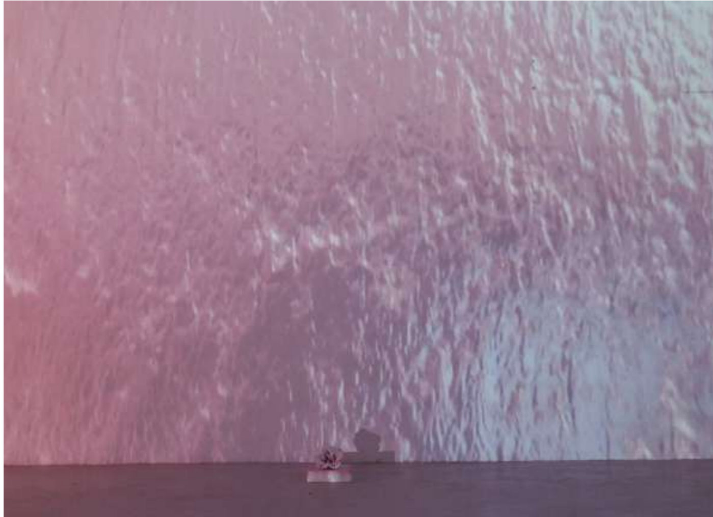
Μπλε συζήτηση, 2017 Installation vidéo projection sur sculpture