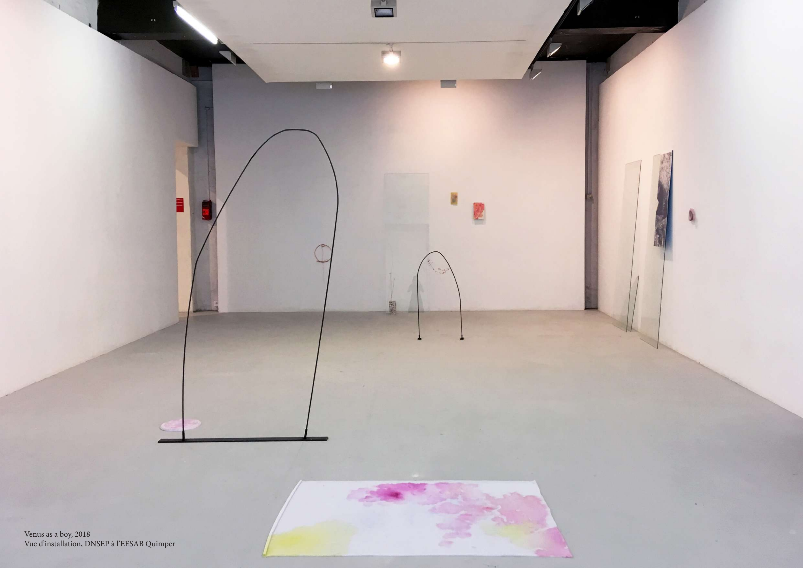
Venus as a boy, 2018 Vue d'installation, DNSEP à l'EESAB Quimper